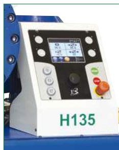
◀ CONTROLLO ELETTRONICO ES3 TOUCH SCREEN ES3 ELECTRONIC CONTROL WITH TOUCH SCREEN