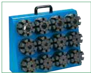
▲ DISPENSER - DISPENSER