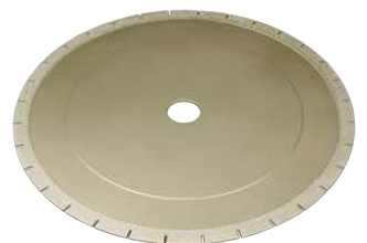
LAMA DIAMANTATA DIAMOND BLADE